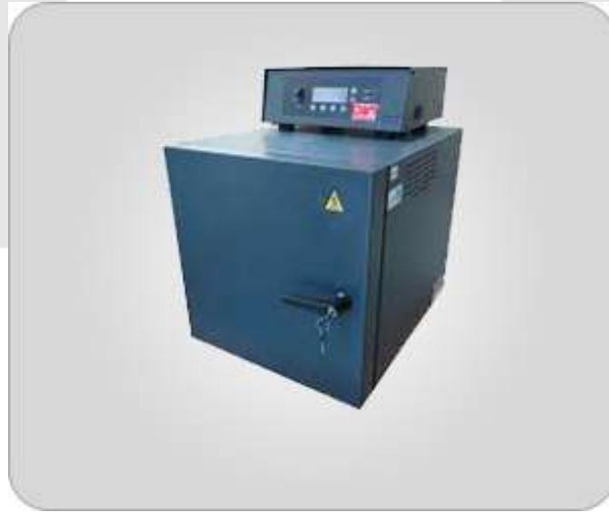
KÜL TAYİNİ TS 336 ISO 247 Met.A