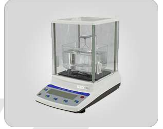
YOĞUNLUK TESTİ (DIN 4698) DIN 53515