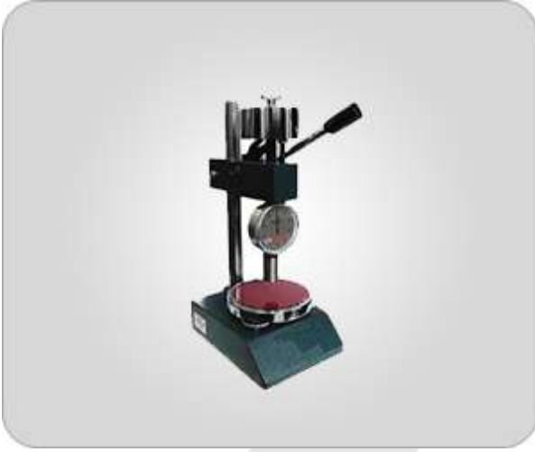
SERTLİK (TS ISO 7619-1) ASTM D 2240 – DIN 53505