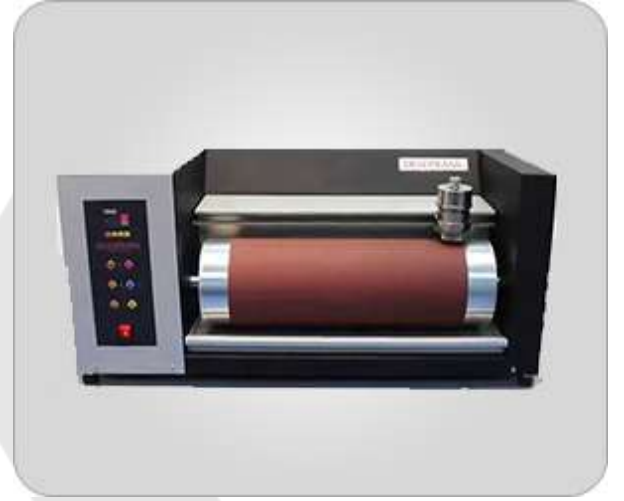
AŞINMA DİRENCİ (DIN 53516)