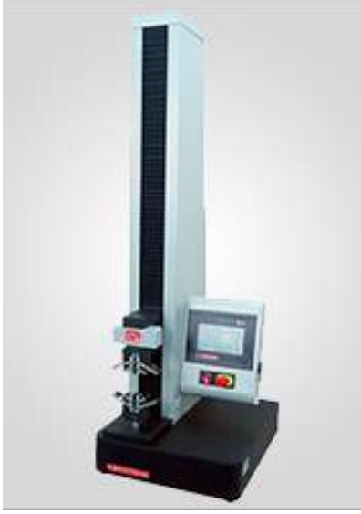
ÇEKME VE MUKAVEMET (TS ISO 37) ASTM D 412 – DIN 53504